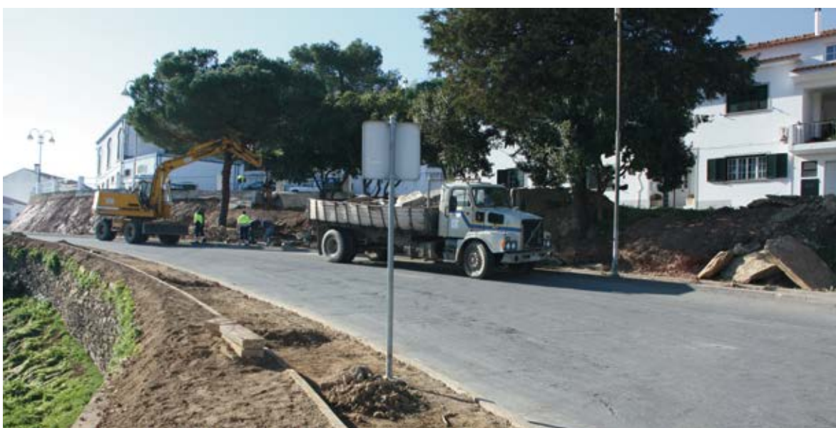
Requalificação urbana em Ourique (junto ao antigo Mercado Municipal)