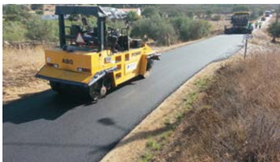
Alcatroamento da estrada do Saraiva