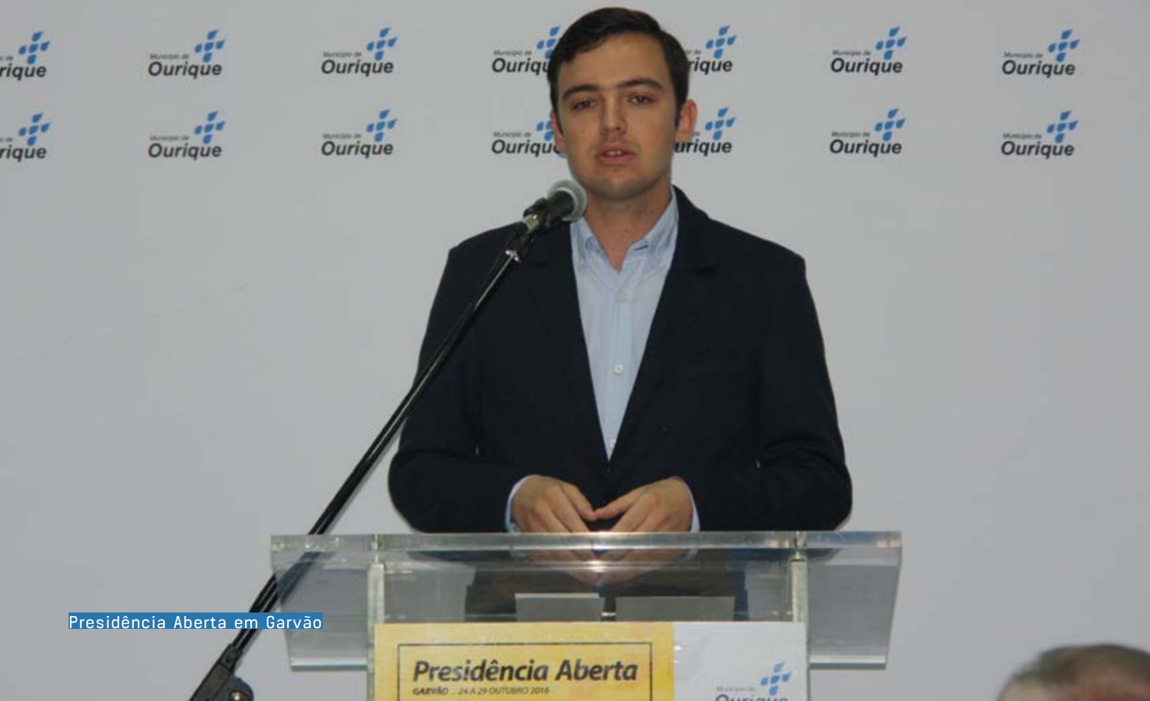
Presidência Aberta em Garvão

Durante o programa da Presidência Aberta, para além da concretização das medidas sociais de apoio aos Ouriquenses, foram visitadas obras importantes para a mobilidade e para as condições de vida de quem escolheu viver e trabalhar no território de Garvão, dos caminhos rurais à electrificação. No que diz respeito à electrificação rural, à falta de financiamento comunitário para o efeito, o Município assegurou o esforço de concretização de investi-