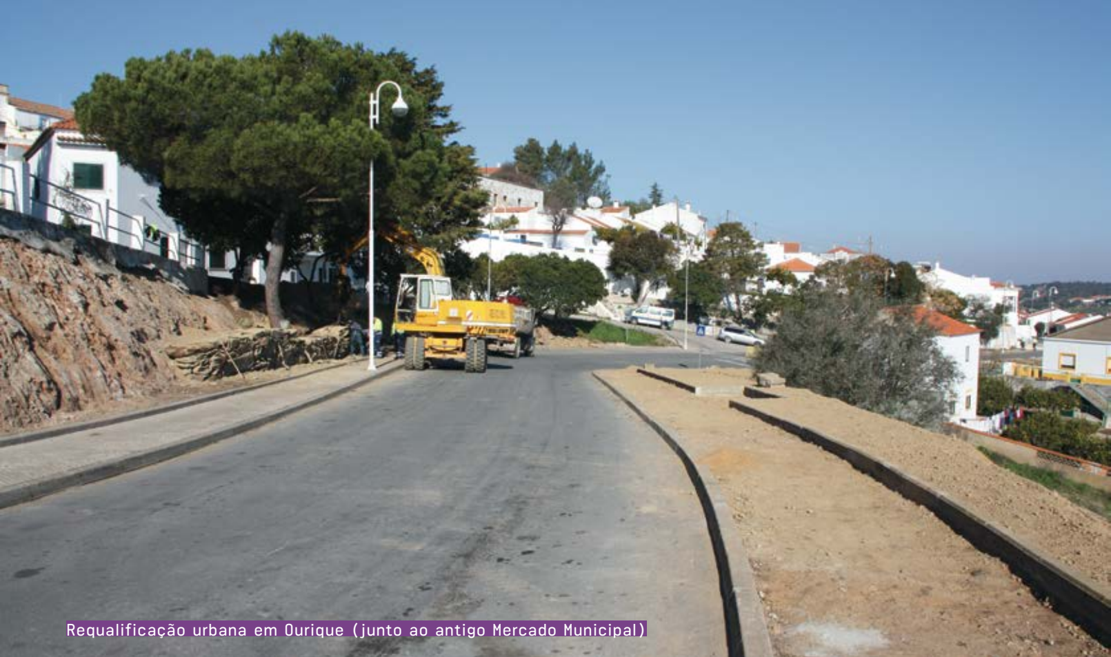
Requalificação urbana em Ourique (junto ao antigo Mercado Municipal)