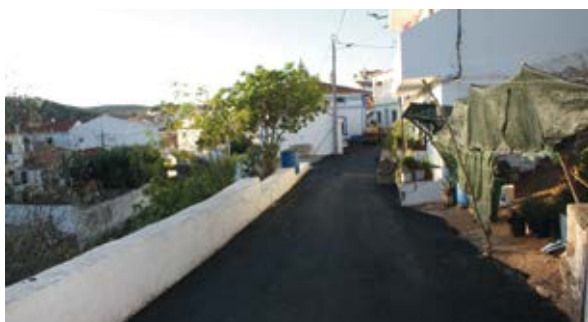
Alcatroamentos em Santana da Serra