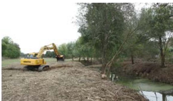
Limpeza da ribeira da Funcheira