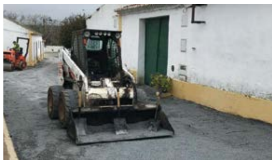
Alcatroamentos em Alcarias