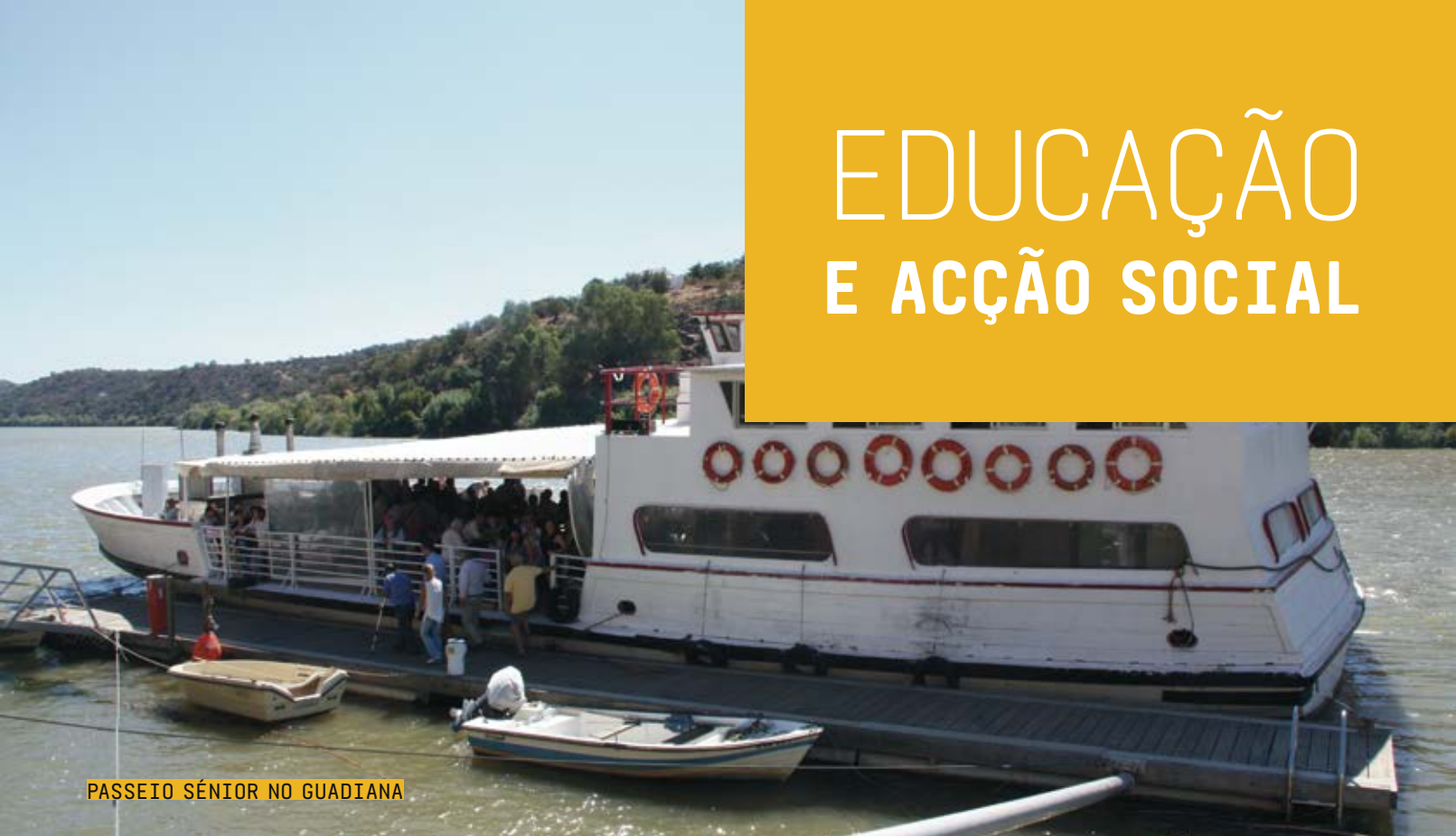
PASSEIO SÉNIOR NO GUADIANA