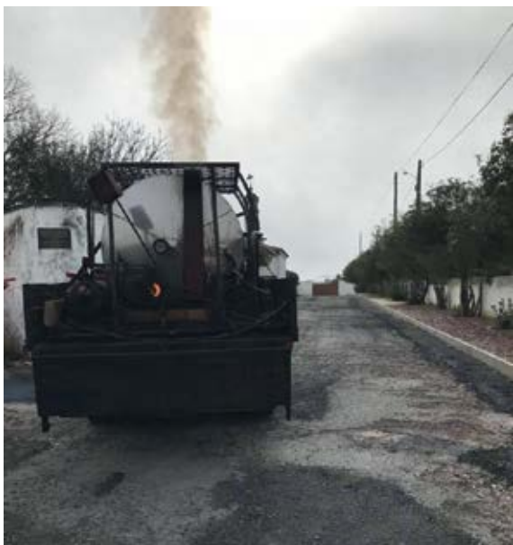
Alcatroamentos em Alcarias