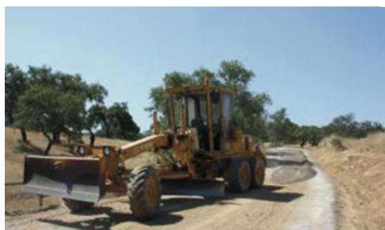
Regualificação de caminhos rurais