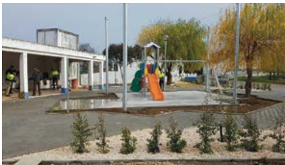
Requalificação do parque infantil de Garvão