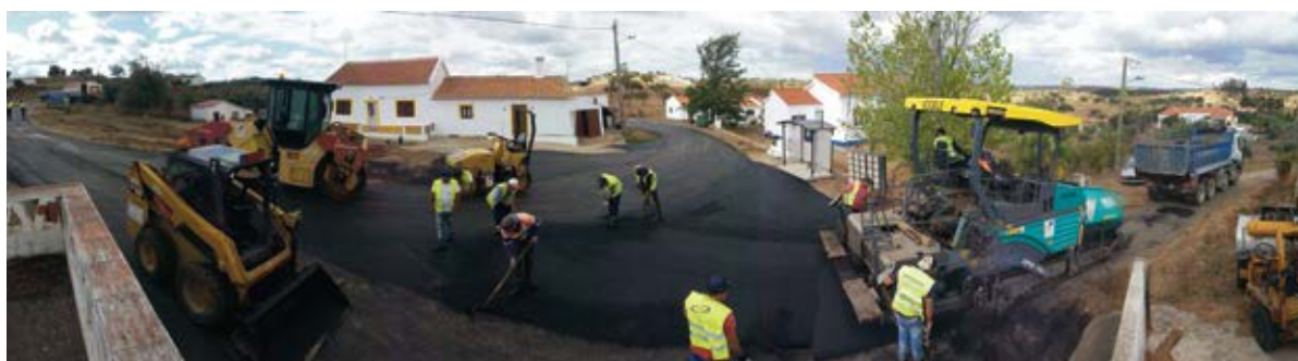
Alcatroamentos no Saraiva