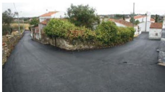
Alcatroamentos na Aldeia de Palheiros