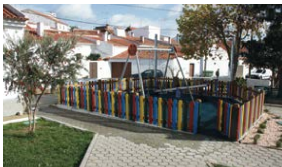
Requalificação do parque infantil de Santa Luzia