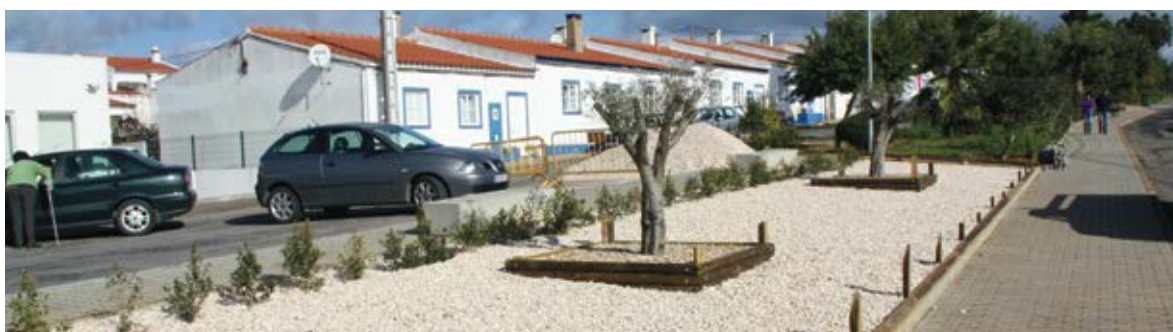
Obras de requalificação na Sardôa (Garvão)