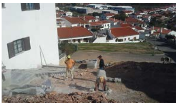
Construção de escadas de acesso ao Rossio (Ourique)