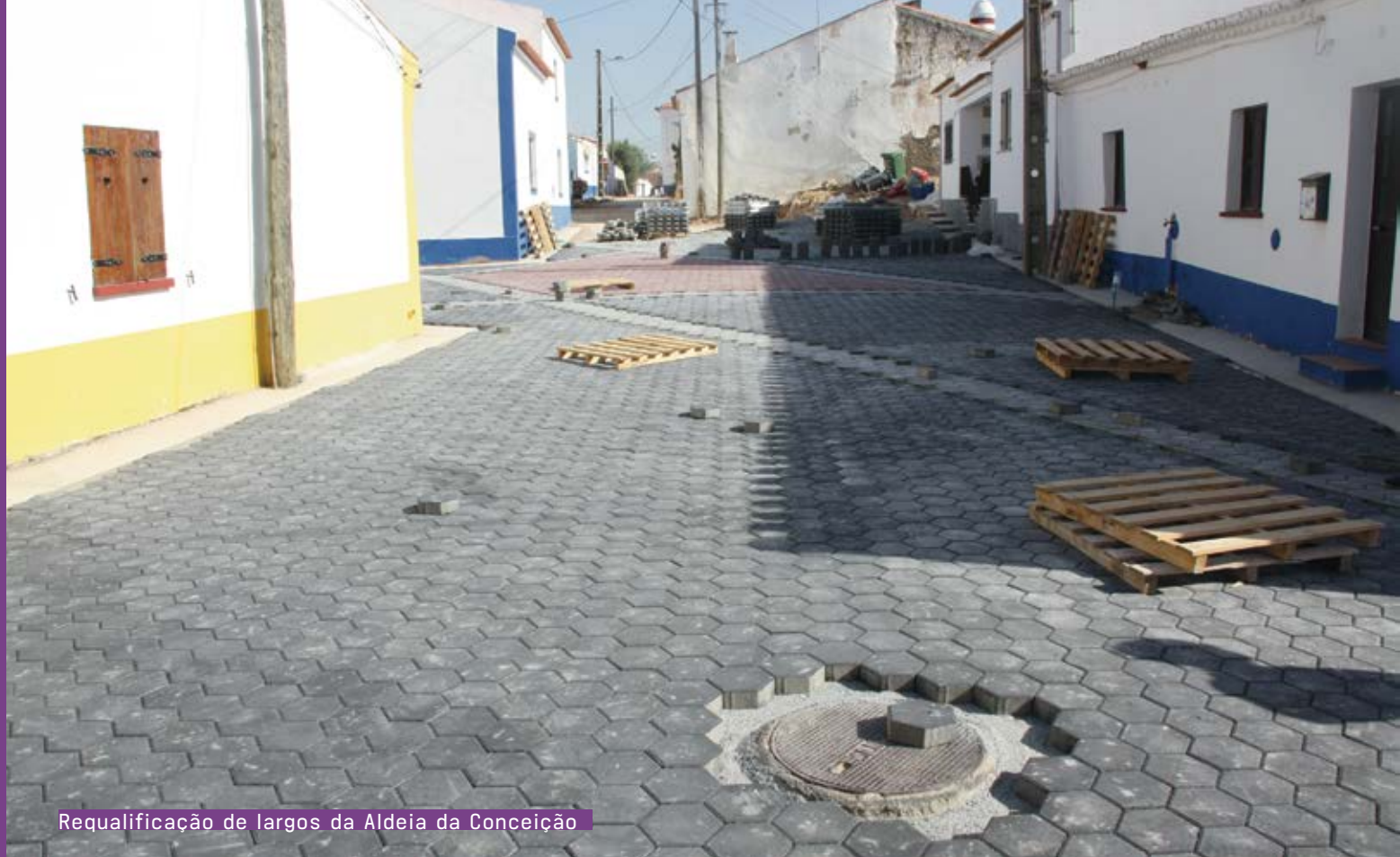
Requalificação de largos da Aldeia da Conceição