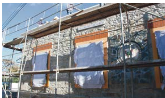
Requalificação da Casa do Povo de Garvão