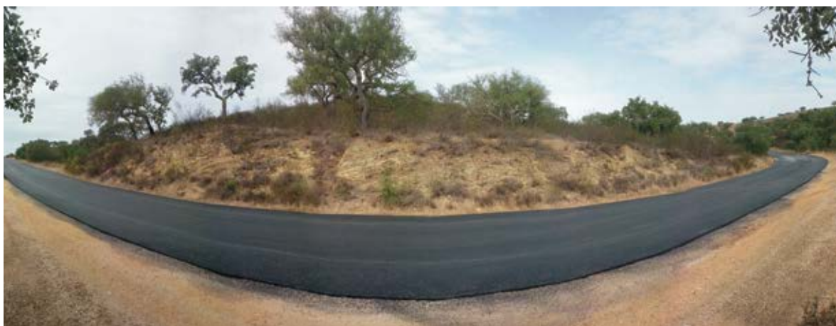
Alcatroamento da estrada do Saraiva